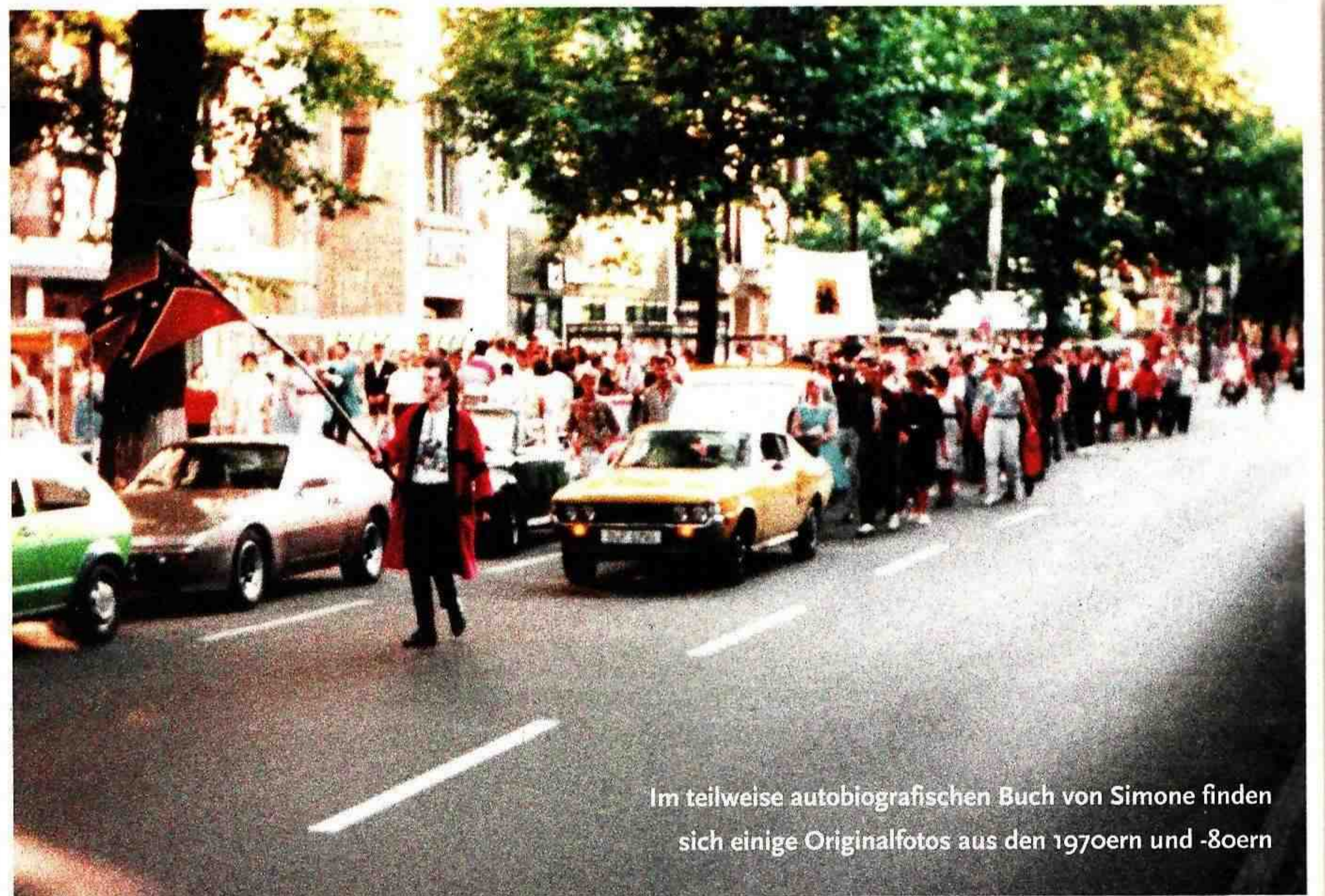
Im teilweise autobiografischen Buch von Simone finden sich einige Originalfotos aus den 1970ern und -80ern

DYNAMITE!: Teddy Girl oder Teddy Boy sind heute für viele Jugendliche Fremdwör-