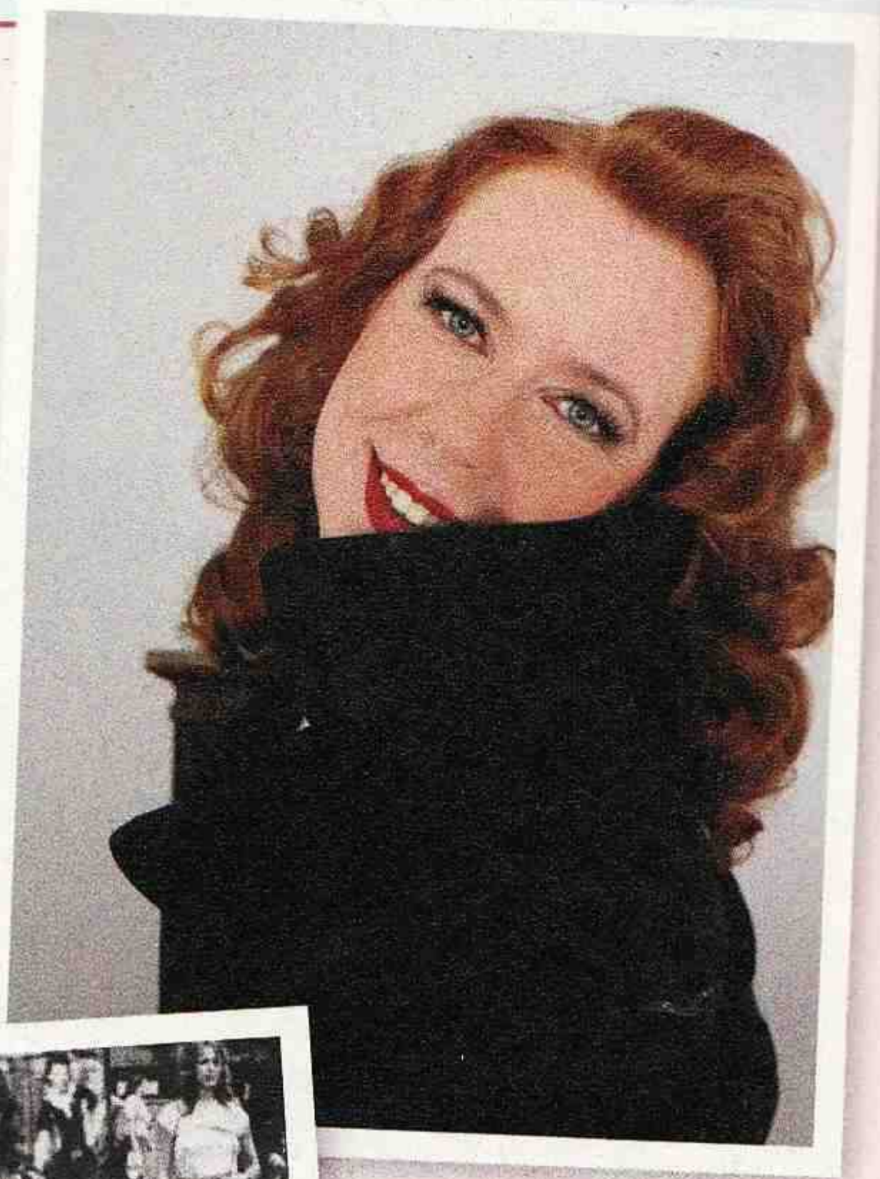
Die fesche Autorin damals und heute, mal keck und mal ganz brav. Schön ist zu sehen, was stylingtechnisch gleich geblieben und was sich gewandelt hat

DYNAMITE!: Ja, könnte ich mir gut vorstellen. Beide Städte haben viele gute Bands, die man wechselweise in Wien und Berlin buchen könnte. Dein Buch hat auf jeden Fall mein Interesse an Berlin geweckt, und vielleicht trifft man ja dort auch den einen oder anderen Protagonisten deines Buches ... ★